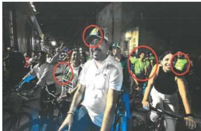
En las imágenes antes insertadas se puede apreciar a diversos ciudadanos y ciudadanas quienes se puede apreciar portan playeras color verde limón cuello redondo, playeras blanca cuello redondo, gorras color verde limón, gorras color