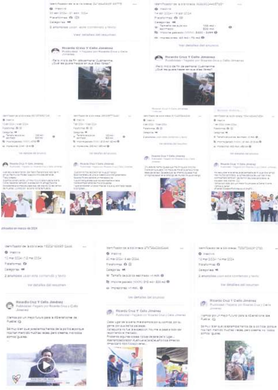
Propaganda electoral, que rompe con los principios que rigen el proceso electoral consistente en la equidad en la contienda electoral que está