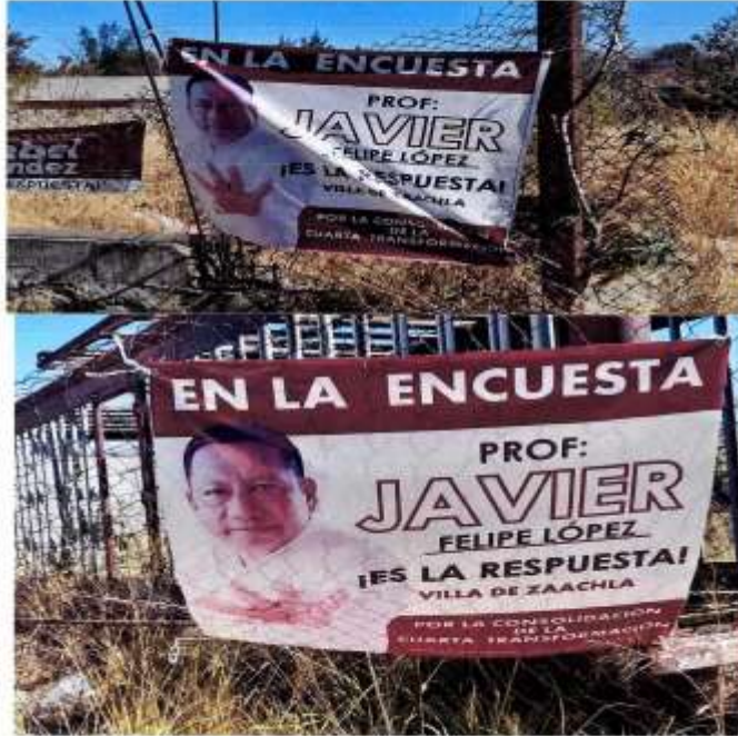
CARRETERA ZAACHILA – VICENTE GURRERO ENTRONQUE CON LA COLONIA EMILIANO ZAPATA Y GUADALUPANA, ZONA ORIENTE