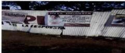
CARRETERA JALPAN- ZAACHILA FRENTE AL LAVA AUTOS BARRIO DEL NIÑO, CASCO MUNICIPAL