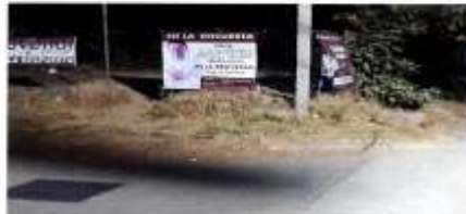
BARRIO DE LA SOLEDAD: ESQUINA DE ZAPOTECA Y NATIPAA, CASCO DE LA POBLACIÓN.