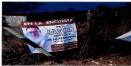
CARRETERA ZAACHILA -REAL DEL VALLE, PASANDO LA CALLE NATIPAA