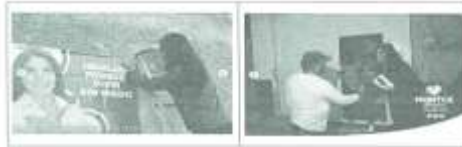
COSTEO DE LOS HALLAZGOS