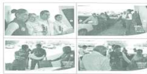
CORTEO DE LOS HALLAZGOS