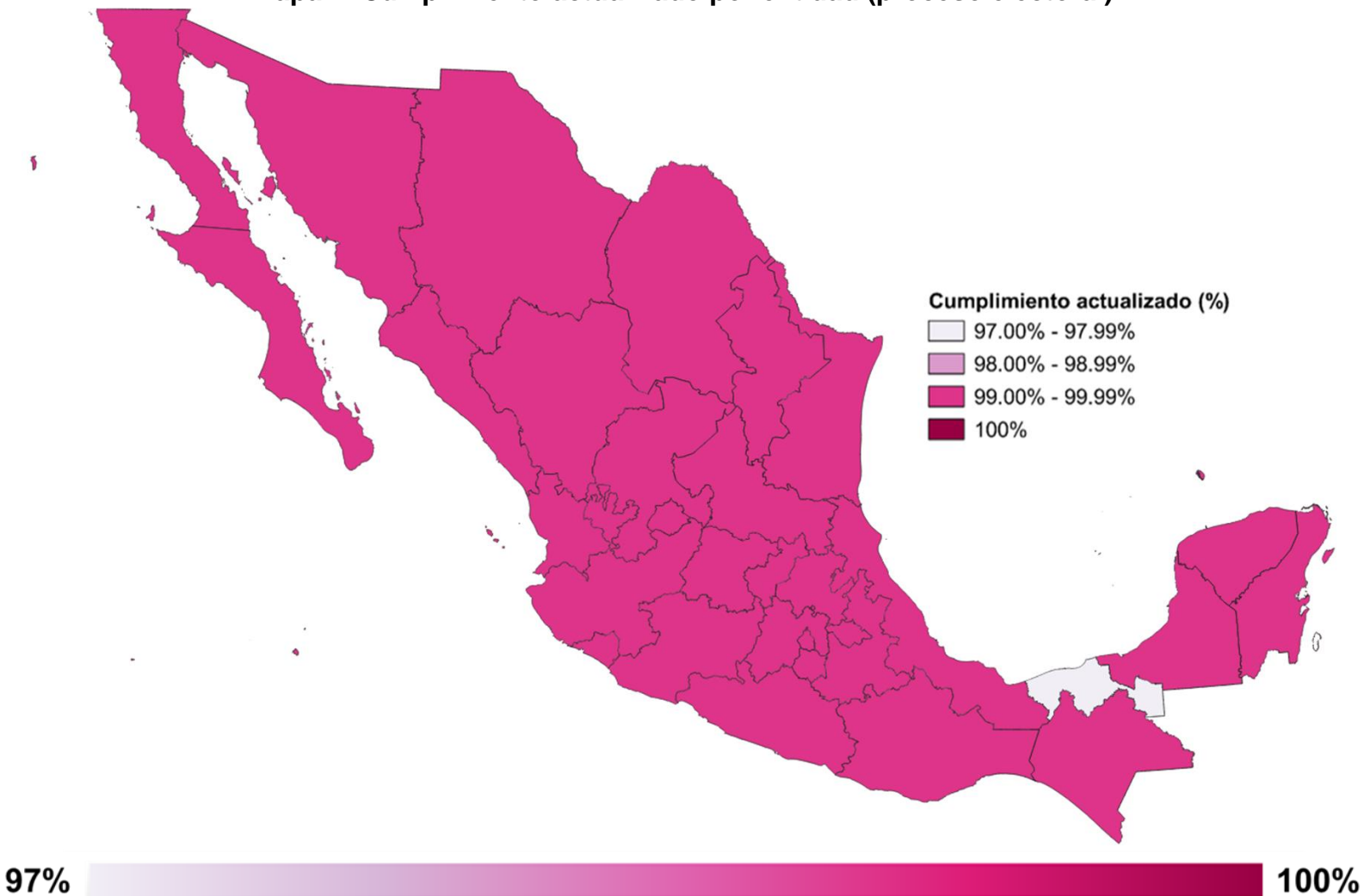
Mapa 1. Cumplimiento actualizado por entidad (proceso electoral)