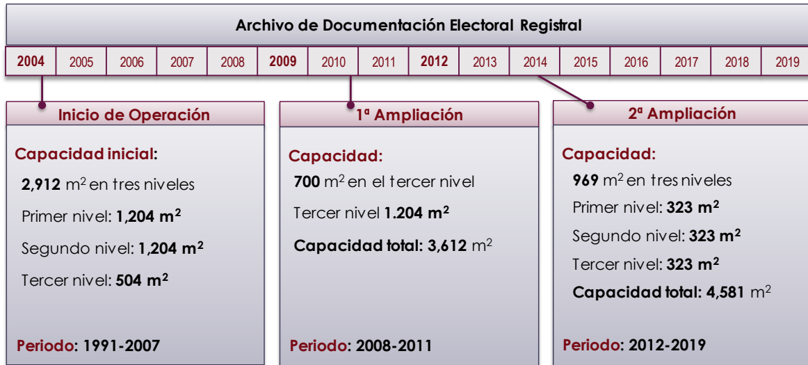
Figura 4. Evolución de la capacidad del archivo de resguardo documental del CECYRD.