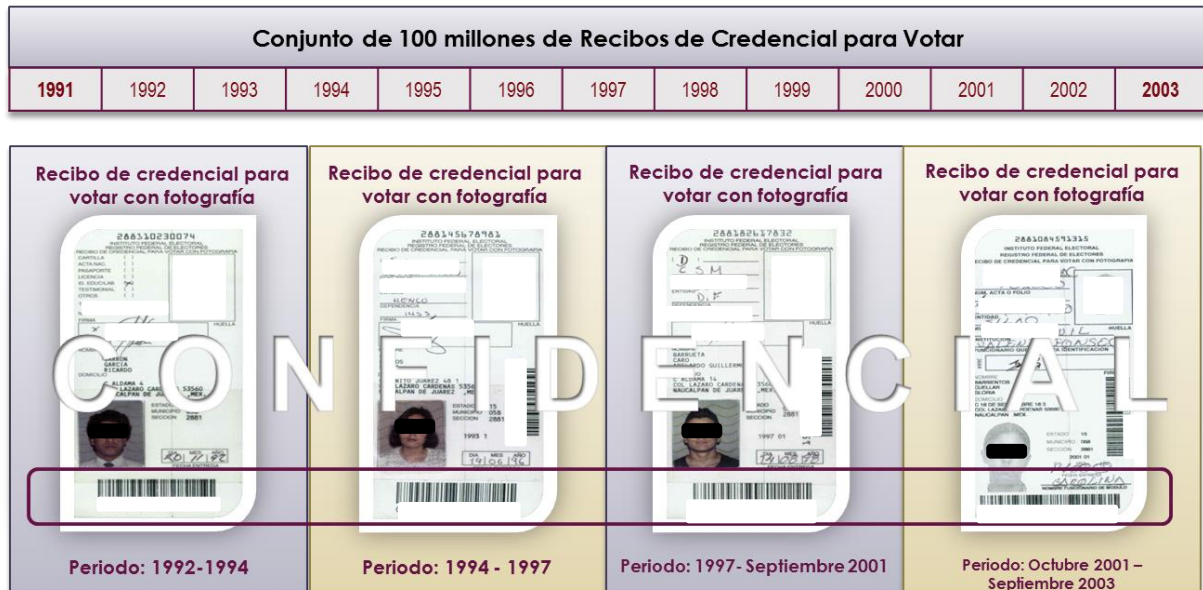
Figura 2. Tipos de Recibos de Credencial generados en el modelo operativo descentralizado.

Cabe mencionar que, la totalidad de los documentos generados en el marco del modelo operativo descentralizado no contaba con los elementos de anclaje que se utilizan para los procesos automatizados de digitalización.