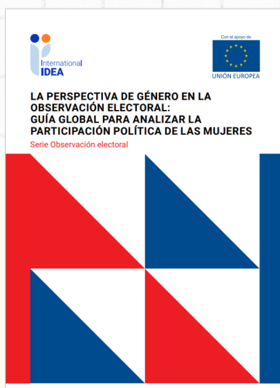
La Perspectiva de Género en la Observación Electoral: Guía Global para Analizar la Participación Política de las Mujeres. Serie Observación Electoral