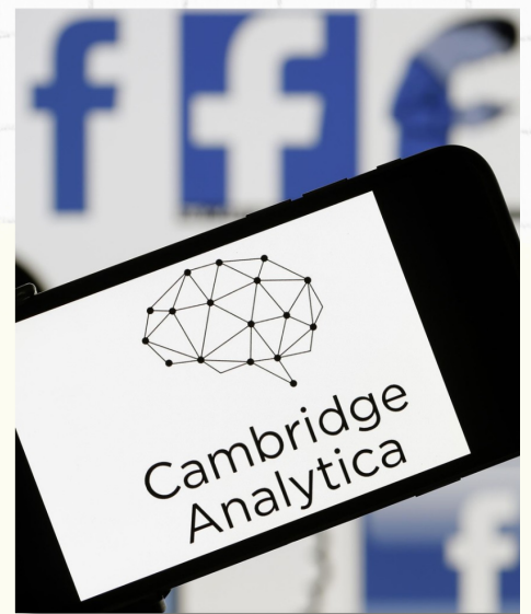
La (des)protección de los datos personales: análisis del caso Facebook Inc. - Cambridge Analytica