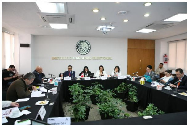
Foto Representantes de los partidos políticos y del Jurado Nacional de Elecciones del Perú.