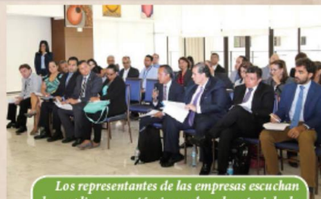
Los representantes de las empresas escuchan las explicaciones técnicas sobre el material y la seguridad del nuevo documento personal.