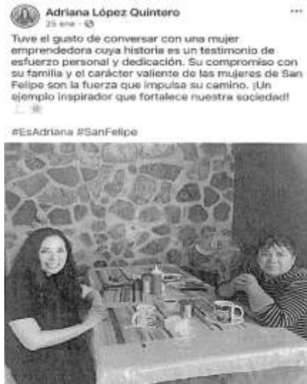
Publicación del 25 de enero de 2024.