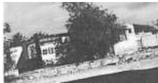
Dirección: Calle mar caribe norte 227