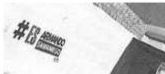
Dirección: Calle Guaymas segunda sección