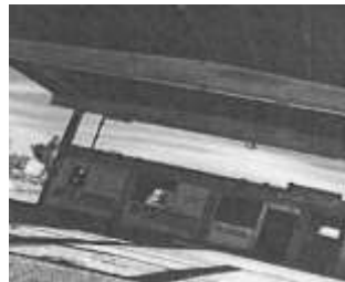
Dirección: Calle mar caribe norte 227