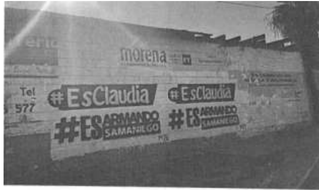
Dirección: Calle Chetumal frente a central de refacciones auto partes