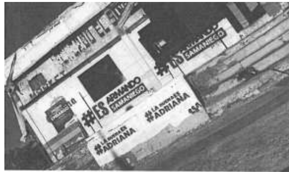
Dirección: Calle Mindanao Norte y Chetumal (en predio sujeto a embargo).