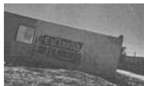
Dirección: Calle Veracruz, frente a taller de soldadura "El chuky", segunda sección