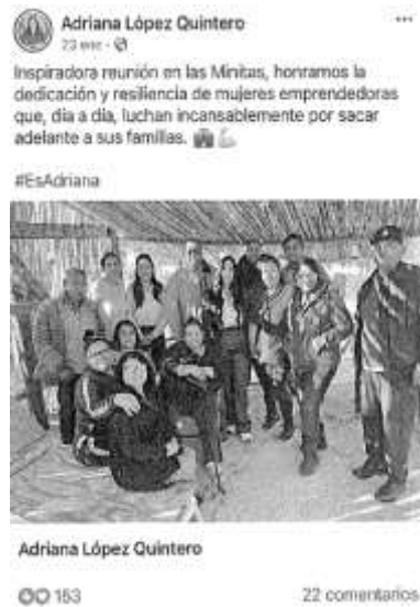
Publicado el 23 de enero de 2024.