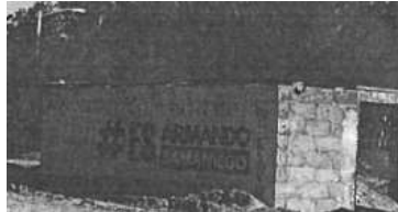
Dirección: Calle mar amarillo entre Veracruz, Segunda sección