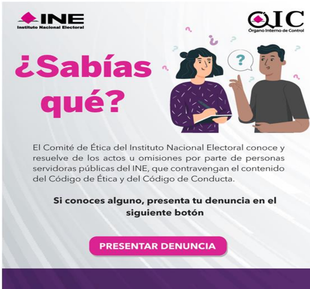
Cuadro 3. Infografía para promover la cultura de la denuncia entre las personas servidoras públicas.