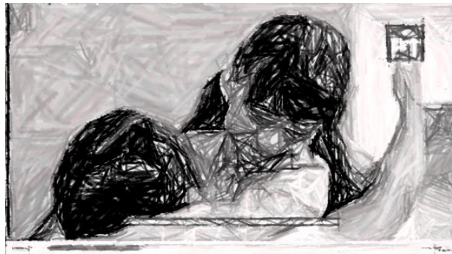
Segundo siete (00:00:07)

En este tenor, es importante reiterar los requisitos establecidos en los numerales 8 y 9, de los Lineamientos para la Protección de Niños, Niñas y Adolescentes en Materia de Propaganda y Mensajes Electorales, para la aparición de personas menores de edad en la propaganda político – electoral, mismos que son al tenor siguiente: