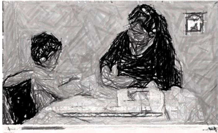
Segundo seis (00:00:06)

En el caso, al realizarse un análisis preliminar al contenido visual de la publicidad bajo estudio, se advierte que, en diversos momentos del video, aparecen dos personas menores de edad como se advierte a continuación: