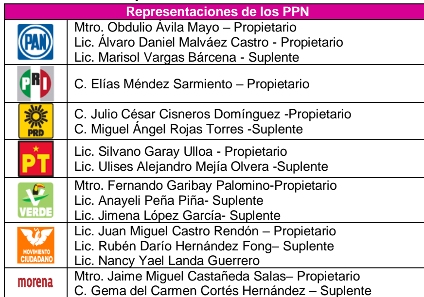
Tabla 2. Integración de la Comisión de Prerrogativas y Partidos Políticos, Representaciones de los PPN