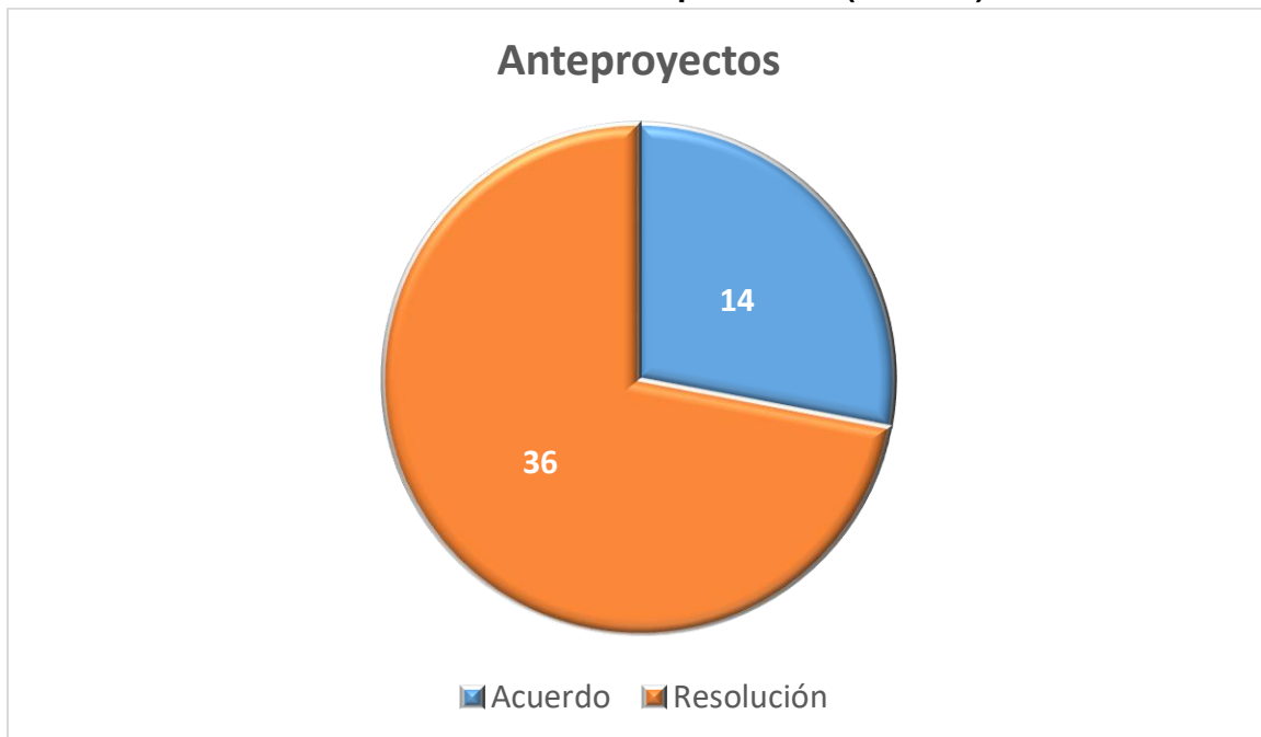
Gráfica 1. Instrumentos aprobados 4 (anexo 3)

En las sesiones reportadas, se aprobaron un total de cincuenta anteproyectos de Acuerdos y de Resoluciones del Consejo General conforme al siguiente cuadro 3 :