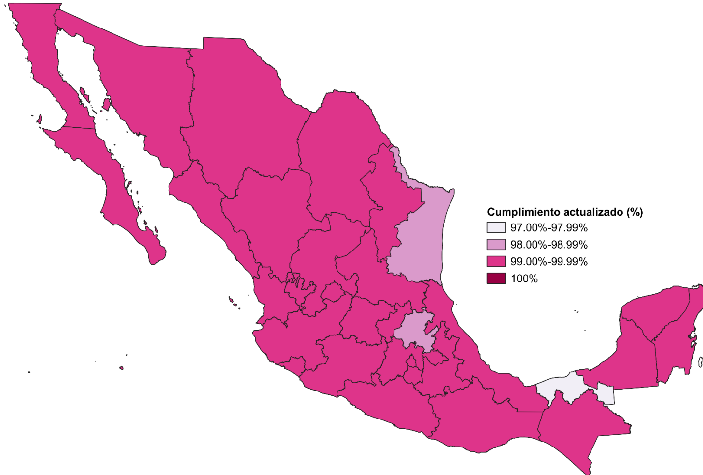
Mapa 1. Cumplimiento actualizado por entidad (proceso electoral)