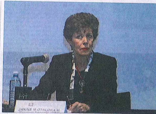
Janine Otálora Malassis, magistrada de la Sala Superior del Tribunal Electoral del Poder Judicial Federal

Este encuentro inició el pasado viernes y concluyó el sábado con el objetivo prin-