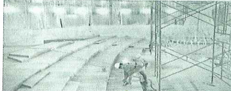
Obras en el teatro José Peón Contreras, donde hubo un incendio en 2022 y cuya fecha de reapertura aún se desconoce. El que en su momento estaba listo, después de unas mejoras, es el Armando Manzanero.

Buen avance tienen los trabajos de rehabilitación del teatro Armando Manzanero que probablemente reabra a mediados de marzo. Sobre el teatro, José Peón Contreras, aún se tiene un buen trecho por recorrer en cuanto a los recursos tras el incendio ocurrido en noviembre de 2022. Se sigue trabajando en el espacio cultural de la capital del Estado para que puedan convivir las nuevas obras o restauración de artistas y el público puedan hacer uso de ellos.