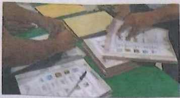
La casa encuestadora Massive Caller dio a conocer los resultados de su consulta sobre preferencias de voto para la gubernatura