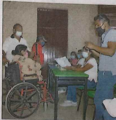
Un momento de la jornada electoral 2021. Una nueva encuesta revela cambios en las intenciones del voto rumbo a los comicios de 2024

PAN 41.9% Morena 34.7% PRI 7.4% PVEM 2.8% Otros 1.8% Aún no decide 11.4% De esta manera, en comparación con la anterior encuesta, el PAN avanzó 1 punto, Morena 1.1, PRI 1.1, PVEM