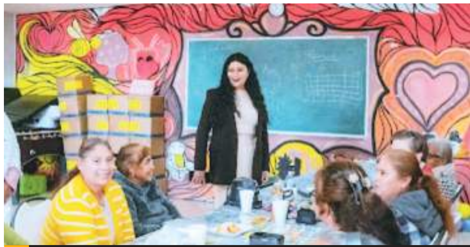
PLAYAS DE ROSARITO.- Proyecta Gobierno Municipal elaborar un plan de acción a corto plazo.

todo en materia de nuevas disposiciones, impuestos y modificaciones dentro de las plataformas gubernamentales o aplicaciones digitales, así como todo aquello que les permita brindar un mejor servicio.