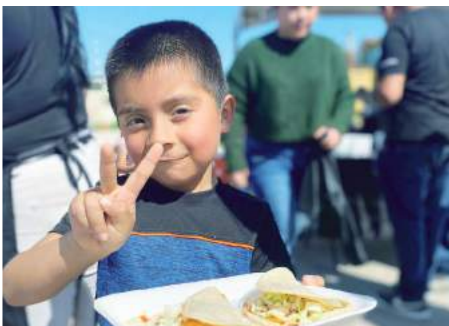
TIJUANA.- Tijuana Sin Hambre celebró en grande el Día del Niño en la comunidad de La Gloria.

de aquellos que más lo necesitan, demostrando que juntos podemos construir un futuro más brillante y solidario para todos.