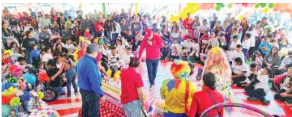
ENSENADA.- Con la práctica de diversas actividades recreativas festejaron el Día del Niño en el Sindicato de Burócratas, en un ambiente de diversión y esparcimiento.

El líder sindical agregó que en este evento participaron cada una de las secretarías que conforman el Comité Ejecutivo Seccional de Ensenada, para atender a la infancia de los agremiados de Ensenada y San Quintín. (bpa).