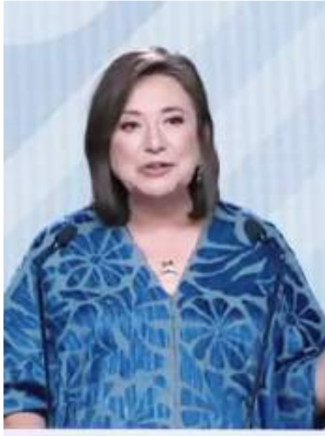
CIUDAD DE MÉXICO.- La esperanza cambió de manos y está de nuestro lado, dijo Xóchitl Gálvez en su mensaje final en el tercer debate presidencial.

“Vamos por la vida, por la verdad, por la libertad. Hoy la esperanza cambió de manos y está de nuestro lado. Y con esa esperanza vamos a ganar. Vota Xóchitl el 2 de junio”, finalizó.