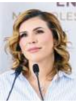
MEXICALI MARINA DEL PILAR ÁVILA OLMEDA...

Ha brindado un apoyo sin precedente a la pesca.