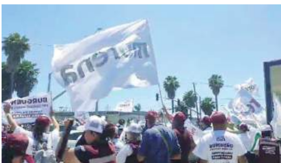
TIJUANA.- Simpatizantes de los candidatos del PRI, PAN, PRD, PT, PES, Movimiento Ciudadano y Morena se reunieron ayer en las afueras del Teatro de la UABC, donde se desarrolló el debate de los candidatos a la Alcaldía de Tijuana.