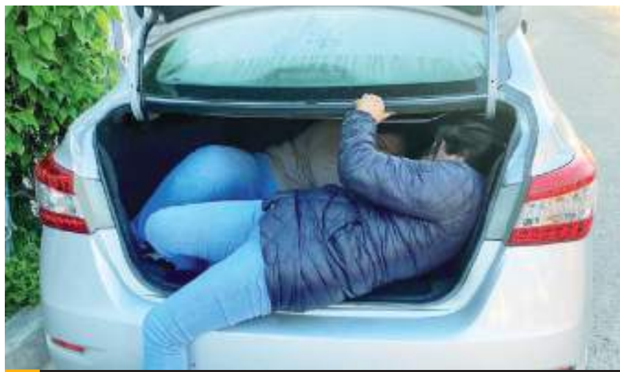
TIJUANA.- Ya son 4 casos de "Mula Ciega" detectados en lo que va del mes de abril, en Tijuana.

de ser localizados al cruzar la línea internacional, pueden ser encarcelados y perder de manera permanente, la posibilidad de obtener asilo en Estados Unidos", señaló el funcionario municipal.