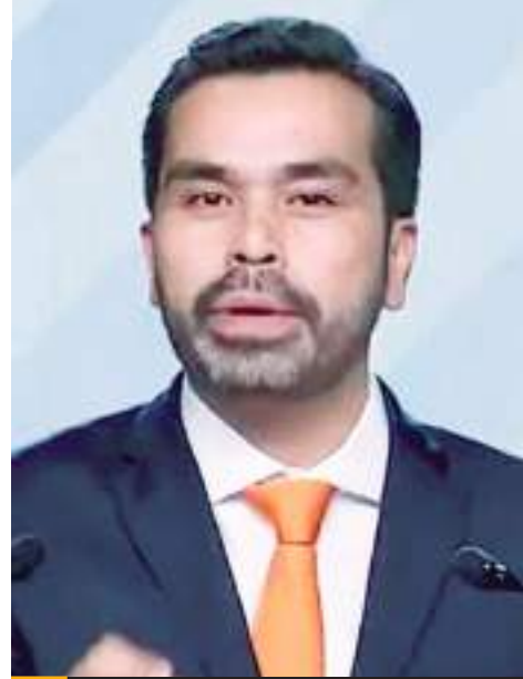
CIUDAD DE MÉXICO.- Jorge Álvarez Máynez, candidato presidencial de Movimiento Ciudadano, llamó a los ciudadanos a salir a votar el próximo 2 de junio, aunque sea por sus dos contrincantes electorales.

“¿De quién te sentirías orgulloso de haber votado? En 10 semanas hemos logrado algo que parecía imposible, darle la vuelta a la elección, pero hoy tenemos un reto más importante que es cambiar el futuro del país, pacificarlo con una buena estrategia de seguridad y construir prosperidad con igualdad de oportunidades.