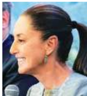
MEXICALI CLAUDIA SHEINBAUM PARDO...

Así como turismo, desarrollo metropolitano, conurbación, infraestructura, comunicaciones y transportes; educación, cultura, ciencia y tecnología; justicia; medio ambiente y desarrollo sus-