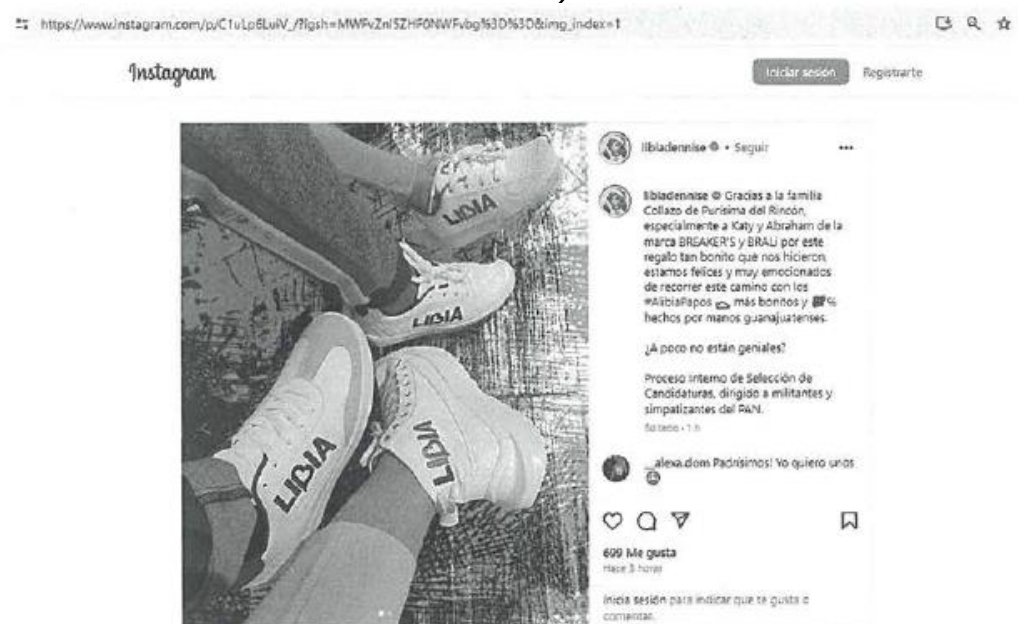
Imagen 11 (De la Publicación Instagram referida)

Verificable y consultable en el siguiente enlace de internet: