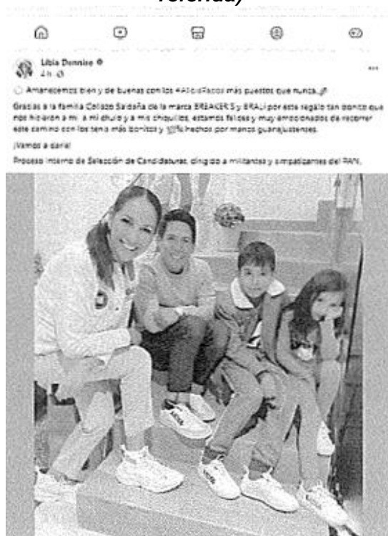
Imagen 11 (De la Publicación Facebook referida)

Verificable y consultable en el siguiente enlace de internet: