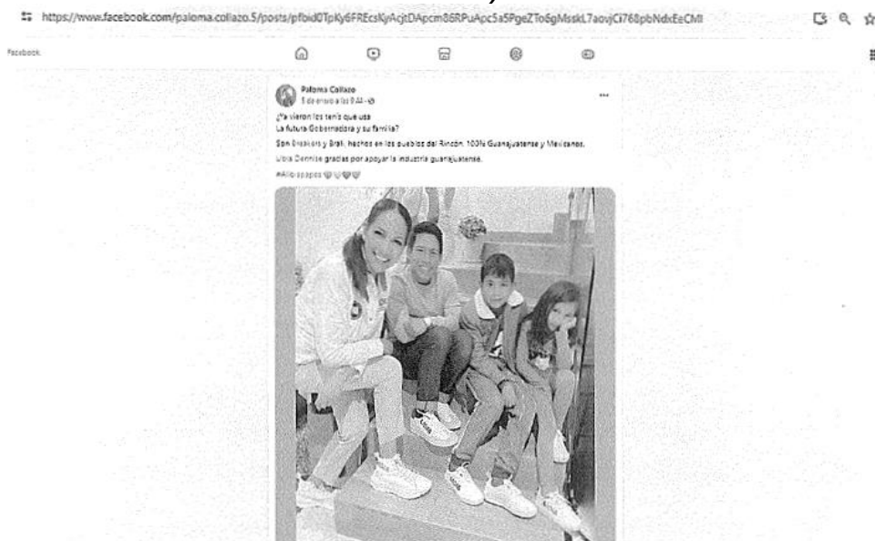
Imagen 13 (De la Publicación Facebook referida)

Verificable y consultable en el siguiente enlace de internet: