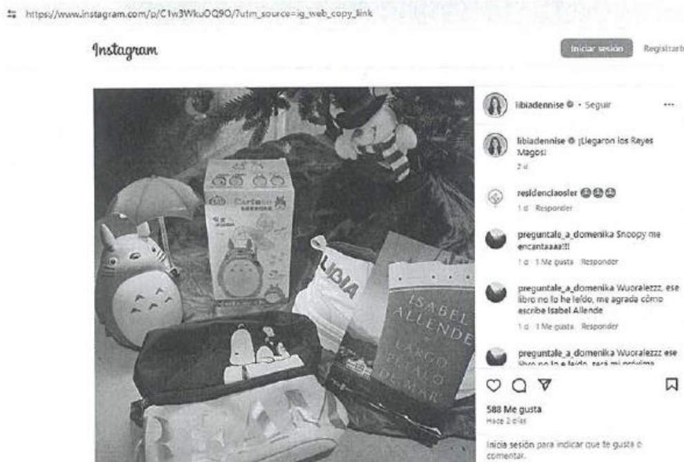
Imagen 19 (De la Publicación en Instagram referida)

Verificable y consultable en el siguiente enlace de internet: https://www.instagram.com/p/C1w3WkuOQ90/?utm_source=ig_web_copy_link