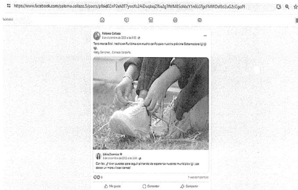
Imagen 14 (De la Publicación Facebook referida)

Verificable y consultable en el siguiente enlace de internet: