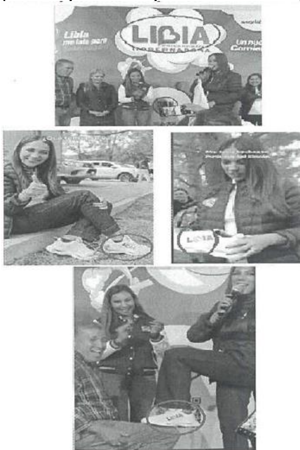
Imagen 05 (De las capturas de la publicación referidas)

Verificables y consultables también en el siguiente enlace de internet ya compartido: