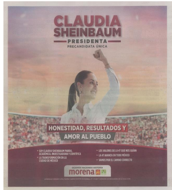
Se aprecia imagen a color con el emblema de Morena, PT y PVEM.

Por otra parte, de la revisión a la contabilidad del partido político Morena identificado con ID 326 , Ámbito Ordinario Federal, se advierte que las imágenes proporcionadas por la parte quejosa son idénticas con las registradas como muestra en la póliza 88, normal, egreso; se aprecian los emblemas de los Partidos Políticos Morena, del Trabajo y Verde Ecologista de México. Es decir, de las muestras que respaldan la póliza 88 se visualizan los tres emblemas de los institutos políticos, así como el mismo diseño, estructura, contenido e imágenes a las aportadas por el quejoso, véase: