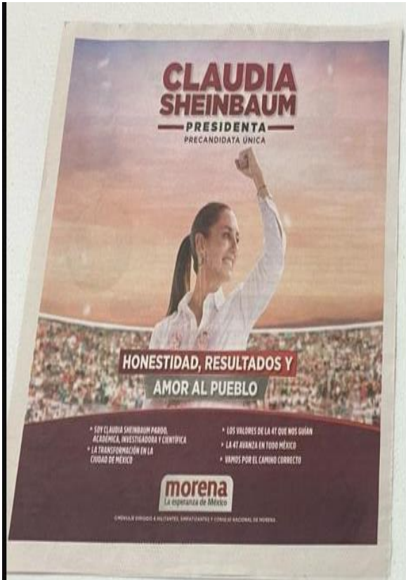
Se aprecia imagen a color con el emblema de Morena en la parte inferior una línea con letras color blanco