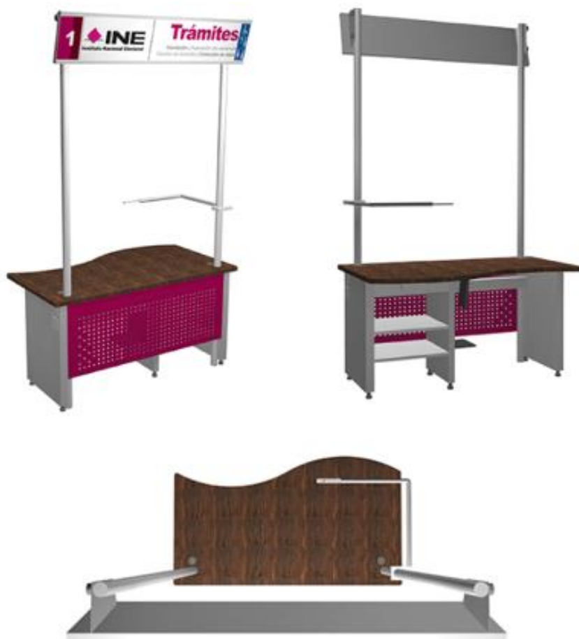
Imagen 1. Vista general de mobiliario de atención ciudadana

Asimismo, es importante mencionar que el Componente “ Dimensiones del equipo de impresión láser monocromático ” de la Tabla 2. Especificaciones técnicas mínimas del presente Anexo Técnico se definió en función de las dimensiones del mobiliario para la atención a la ciudadanía en los MAC de Imagen Institucional , cuyas dimensiones a continuación se presentan: