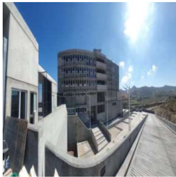
Acceso Estacionamiento, Exteriores