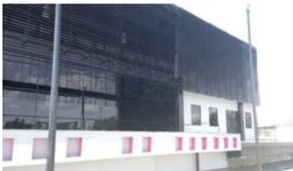
Aplicación de pintura de esmalte en fachadas y estructura metálica.