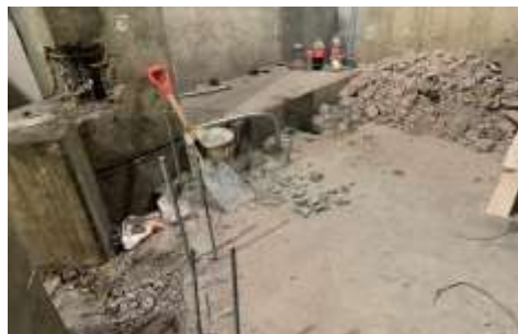
Demolición en Foso del Montacoches