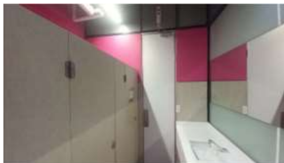
Acabados en pisos y muros con loseta cerámica y pintura vinílica e instalación de muebles y accesorios sanitarios.