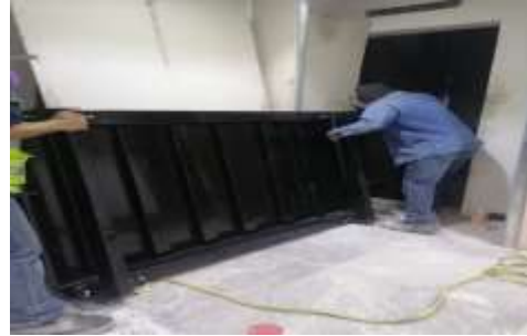
Inicio de Instalación de Elevador 1