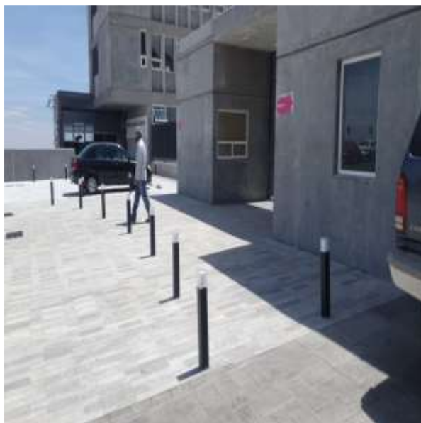
Plaza de Acceso, Exteriores