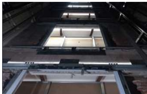
Adecuaciones y Adaptaciones en cubículos y cuarto de máquinas