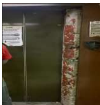
Desmontaje y desinstalación de Elevador 2