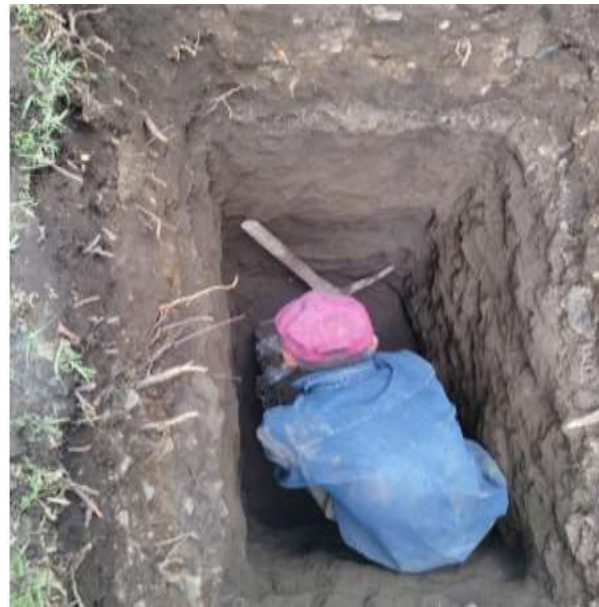
Estudio de mecánica de suelos