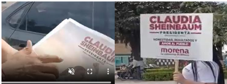
Imágenes representativas [ampliación]

Voz masculina off: No, no, nada más hasta hoy.