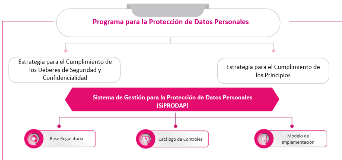
Figura 1. Modelo de Protección de Datos Personales

Datos Personales respecto del SiPRODAP, en observancia de la LGPDPPSO, durante un periodo de dos años.