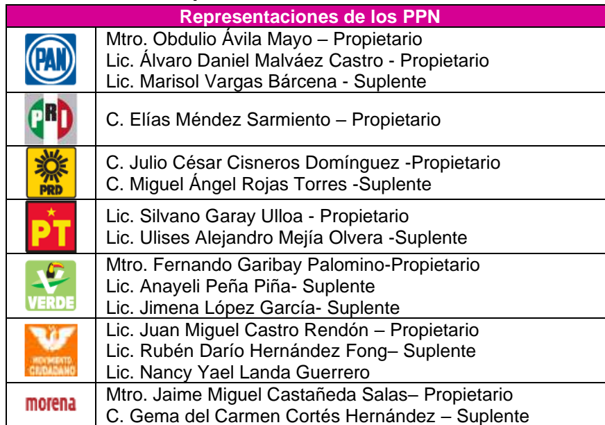
Tabla 2. Integración de la Comisión de Prerrogativas y Partidos Políticos, Representaciones de los PPN