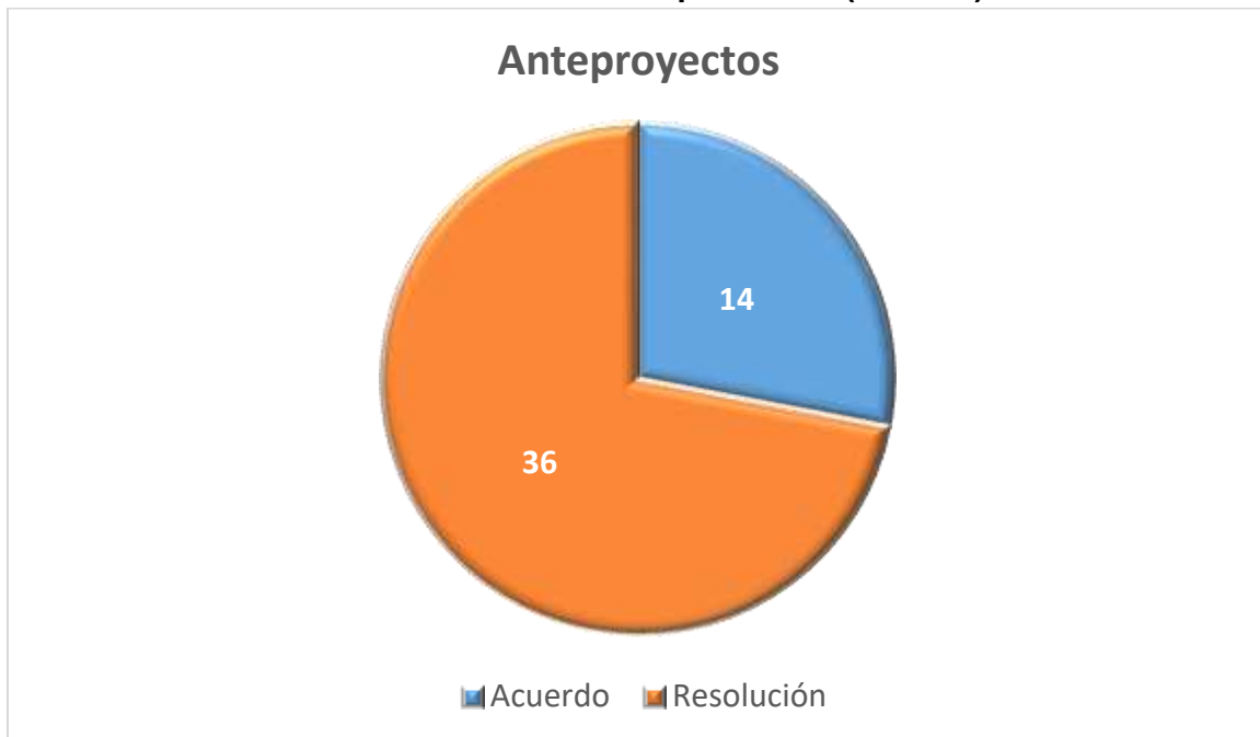
Gráfica 1. Instrumentos aprobados 4 (anexo 3)

En las sesiones reportadas, se aprobaron un total de cincuenta anteproyectos de Acuerdos y de Resoluciones del Consejo General conforme al siguiente cuadro 3 :