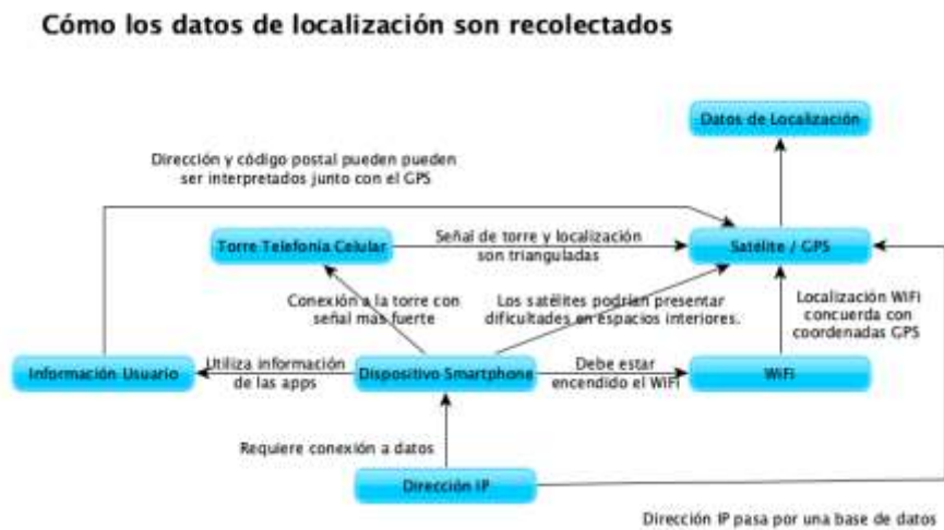
Geolocalización en dispositivos móviles 208 .

De manera adicional y aportando mayores elementos a lo antes señalado, la DERFE indicó que los dispositivos móviles hacen uso de tecnologías GPS y componentes adicionales, como torres de telefonía, WiFi o incluso, Bluetooth para determinar la posición del dispositivo utilizado, tal y como se presenta en el diagrama siguiente: