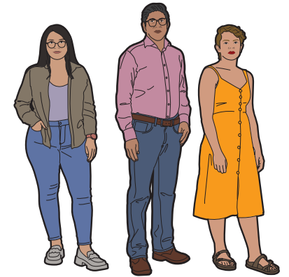
3 suplentes generales