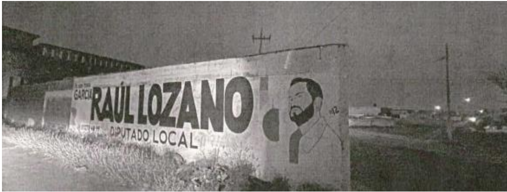
8. En Topacio 124, 66004 García, N.L., se encuentran una pared pintada que dice "Ya nos toca García" y agrega "Raúl Lozano, Diputado Local y un dibujo con su imagen, la ubicación imagen siguiente: https://maps.app.goo.gl/hTDUnYHTmSukWwKK6