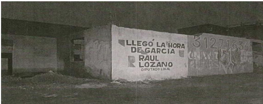
15. En Olivo 405, Ampliación Los Nogales, 66006 García, N.L., se encuentra una pared pintada que dice "Llego la hora de García" y agrega "Raúl Lozano, Diputado Local, en la ubicación e imagen siguiente: https://maps.app.goo.gl/aUp9tkaURrXSAuMU8