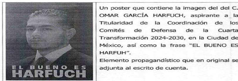
Un poster que contiene la imagen del del C. OMAR GARCÍA HARFUCH, aspirante a la Titularidad de la Coordinación de los Comités de Defensa de la Cuarta Transformación 2024-2030, en la Ciudad de México, así como la frase "EL BUENO ES HARFUH". Elemento propagandístico que en original se adjunta al escrito de cuenta.

4. Derivado de lo manifestado en los hechos que anteceden, se aprecia que los denunciados, el partido político Morena, así como el C. OMAR GARCÍA HARFUCH, aspirante a la Titularidad de la Coordinación de los Comités de Defensa de la Cuarta Transformación 2024-2030, en la Ciudad de México, en todo el ámbito territorial, se encuentra repartiendo propaganda que beneficia