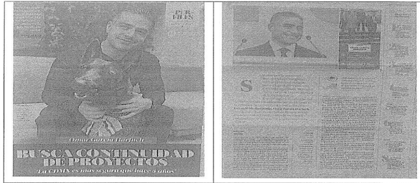
Dos dípticos tamaño doble carta, a colores; en la parte delantera y trasera, se aprecia la imagen del C. OMAR GARCÍA HARFUCH, aspirante a la Titularidad de la Coordinación de los Comités de Defensa de la Cuarta Transformación 2024-2030, en la Ciudad de México. Elemento propagandístico que en original se adjunta al escrito de cuenta.