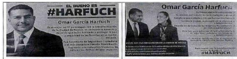
Dos dípticos tamaño media carta, a colores; en la parte delantera y trasera, se aprecia la imagen y nombre del C. OMAR GARCÍA HARFUCH, aspirante a la Titularidad de la Coordinación de los Comités de Defensa de la Cuarta Transformación 2024-2030, en la Ciudad de México, así como la frase "EL BUENO ES #HARFUH"; Elemento propagandístico que en original se adjunta al escrito de cuenta.