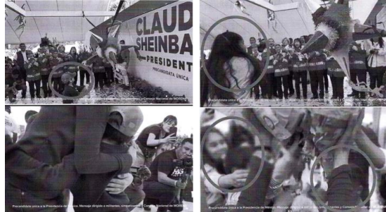
No identificables y rostro difuminado