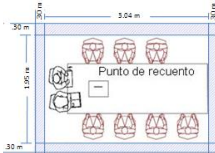
Imagen 1 Espacio mínimo para instalar un Punto de Recuento

Con base en lo anterior y atendiendo el límite de instalación de hasta 8 PR en cada GT que aplicaría únicamente para recuentos parciales de un alto número de paquetes o el recuento total, la posibilidad de instalar un máximo de dos PR adicionales a los señalados en la Tabla 4 dependerá de la valoración que se realice por cada CD respecto a los espacios propuestos para realizar el recuento de votos, a partir de la propuesta que presente la JDE.