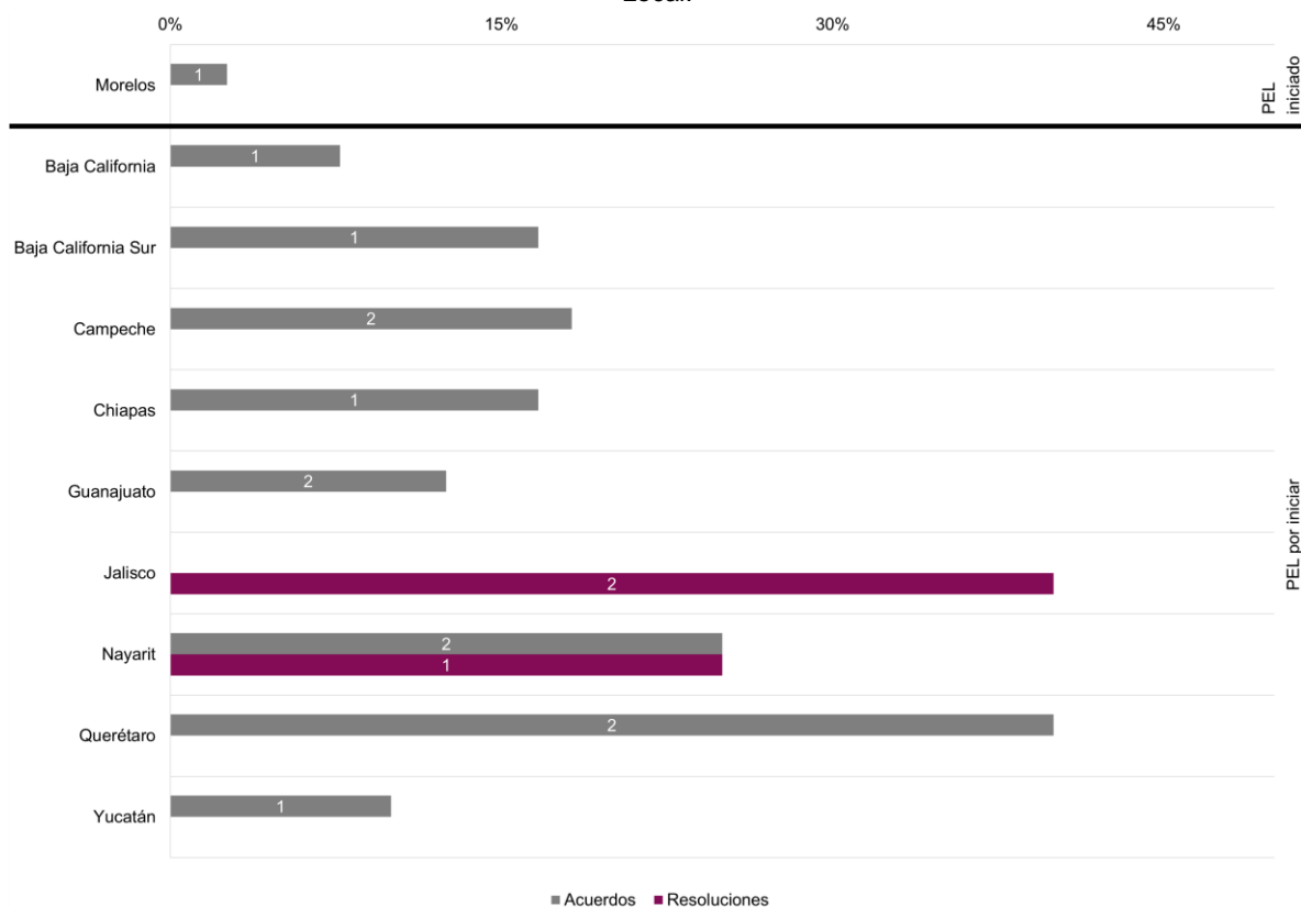
Gráfica 4. Documentos aprobados en lo general por mayoría, por entidad y estatus del Proceso Electoral Local.