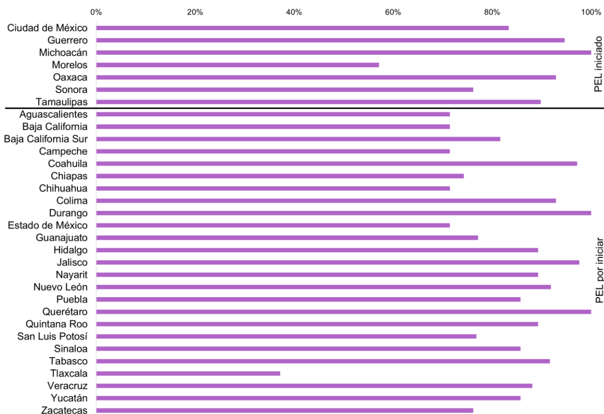
Gráfica 3. Asistencia promedio de representaciones de los partidos políticos nacionales a sesiones de los CG de los OPL, por entidad y estatus del Proceso Electoral Local.