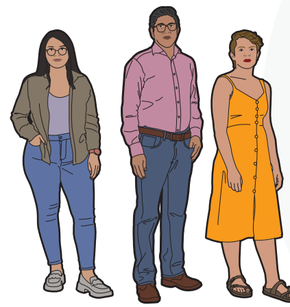
3 suplentes generales