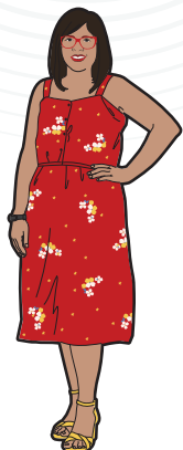
1 Presidente o Presidenta

Son personas como tú, que se convierten en autoridad electoral ciudadana al ocupar un cargo en la mesa directiva de casilla el día de la elección. En este proceso electoral, cada mesa directiva de casilla se integrará por los siguientes cargos: