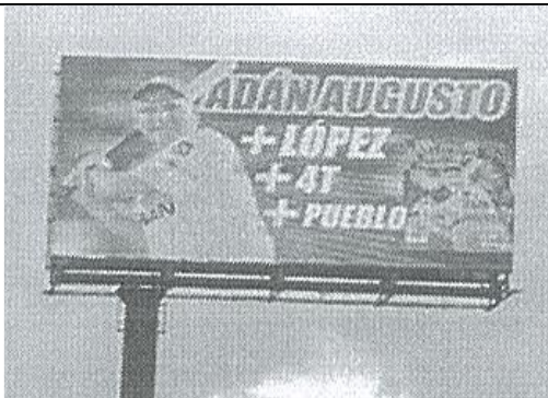
Ignacio Comonfort 22, Emiliano Zapata, 56490, Los Reyes Acaquilpan, Méx.