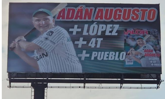
Autopista México-Puebla México 150D, 56535. México.