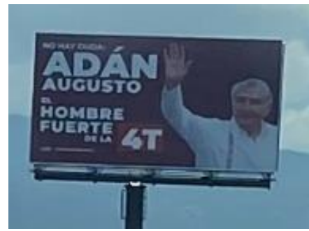
Autopista México-Puebla México 150D, Agrarista, Ixtapaluca. México.