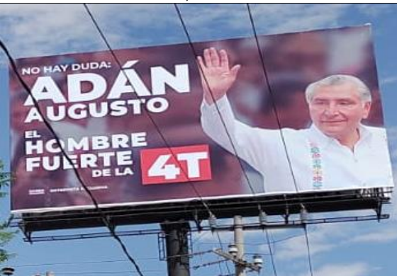
Autopista México-Puebla 265 Avándaro, 56618, Valle de Chalco Solidaridad, México.