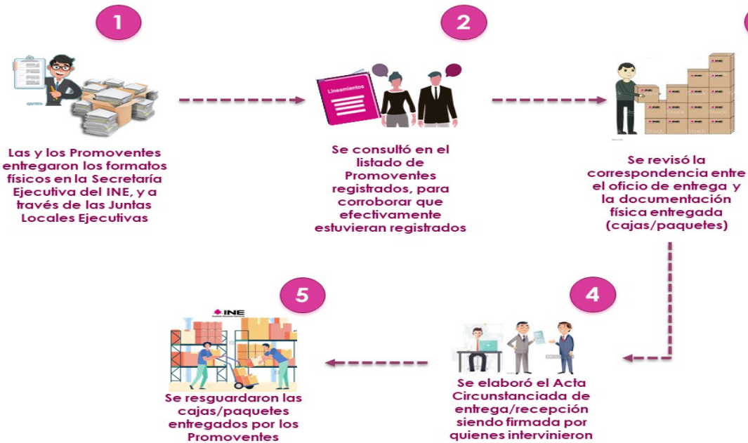
Diagrama 1. Flujo Operativo de la recepción de formatos físicos.

En el siguiente diagrama se muestra el flujo de operación aplicado para el desarrollo de las actividades.