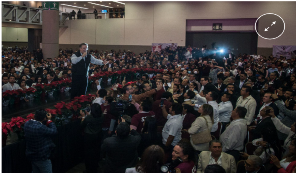
Marcelo Ebrard en el evento del World Trade Center el sábado pasado.

Marcelo Ebrard, Claudia Sheinbaum, Adán Augusto López y Ricardo Monreal ya comienzan a delinear el plan para demostrar músculo las próximas semanas. El canciller anunció el pasado fin de semana que recorrerá los 300 distritos electorales, el banderazo de salida oficial de su campaña. “Primero tenemos que ganar una encuesta, que por ahí alguien dice que ya la tiene, que ya esto y que ya lo otro. Todavía no empezamos. Hoy empezamos”, dijo Ebrard en un acto con 10.000 personas en el World Trade Center de Ciudad de México. El mensaje es para Sheinbaum, puntera en el grueso de las encuestas, aunque la única que importa es la que celebrará Morena para definir la candidatura.