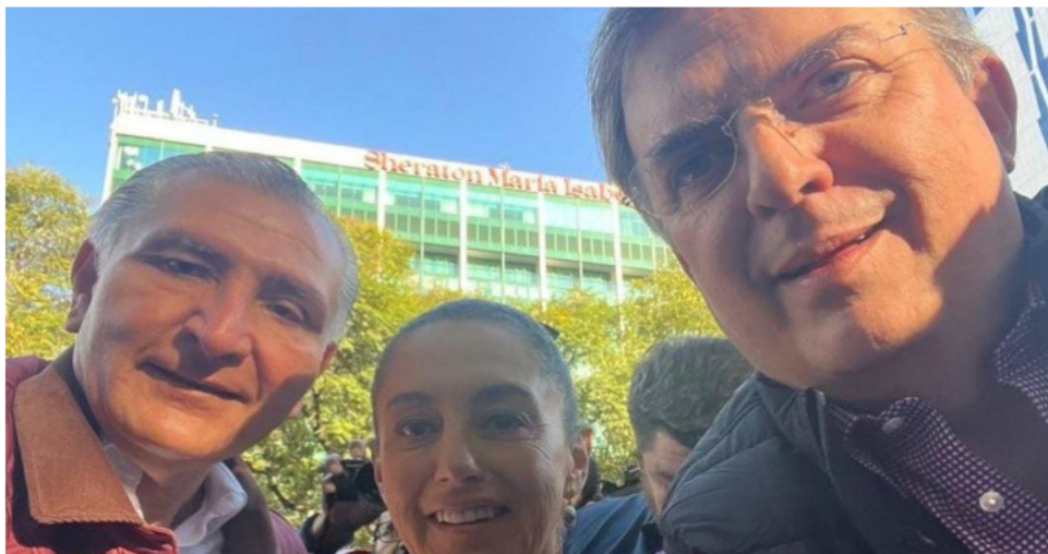
Adán Augusto López, Claudia Sheinbaum y Marcelo Ebrard en la marcha convocada por Andrés Manuel López Obrador, el 27 de noviembre.

Los principales candidatos del partido de López Obrador se preparan para mostrar músculo y jugarse su futuro político en los próximos meses