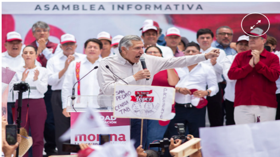
Adán Augusto, durante la asamblea informativa de MORENA el 12 de junio de 2022.

Mientras el discurso de Ebrard se centra en abrir un nuevo capítulo dentro de la “Cuarta Transformación”, Sheinbaum es más directa al hablar de dar continuidad al proyecto de López Obrador y de defender que ella es de las que construyó y estuvo en Morena desde el primer momento. El politólogo Fernando Dworak considera que, a pesar de la cercanía con el presidente y de las giras de fin de semana, Sheinbaum tiene que buscar cierta autonomía y trabajar en su imagen pública. “No es una líder de masas”, afirma el analista. “Es un reto para cualquiera que pretenda sustituir a López Obrador: construirse un carisma propio más allá del presidente”, agrega Dworak.