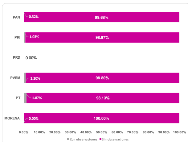
Solicitudes de RG con observaciones por PPN