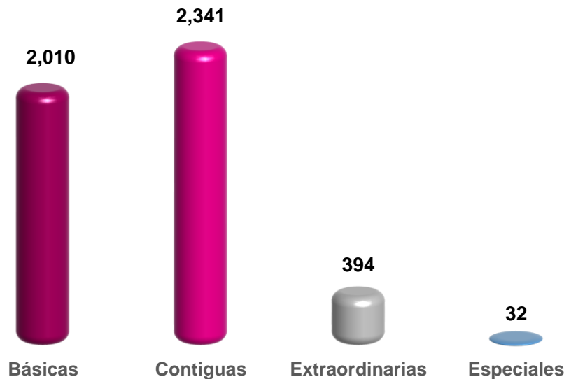
Gráfica 1 Distribución de casillas aprobadas según tipo