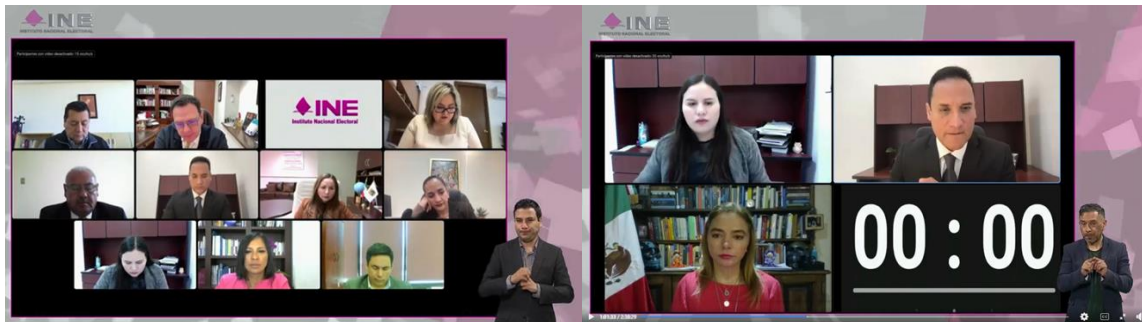
Ilustración 2: Celebración de los eventos