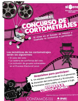
Ilustración 3: Banner difusión próxima publicación de la convocatoria