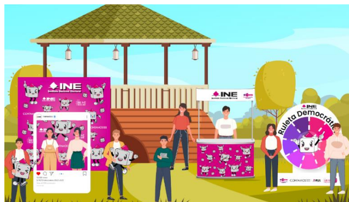
Ilustración 4: Activaciones culturales territoriales, recreación de los eventos.

Las actividades territoriales abordarán las siguientes temáticas: