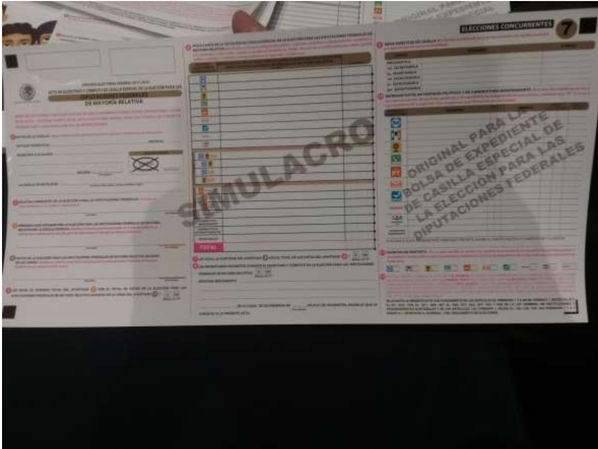
Modelo de Acta de Escrutinio y cómputo de casilla especial de la Elección para las Diputaciones Federales de Mayoría Relativa, utilizada en las Elecciones del 1 de julio de 2018.