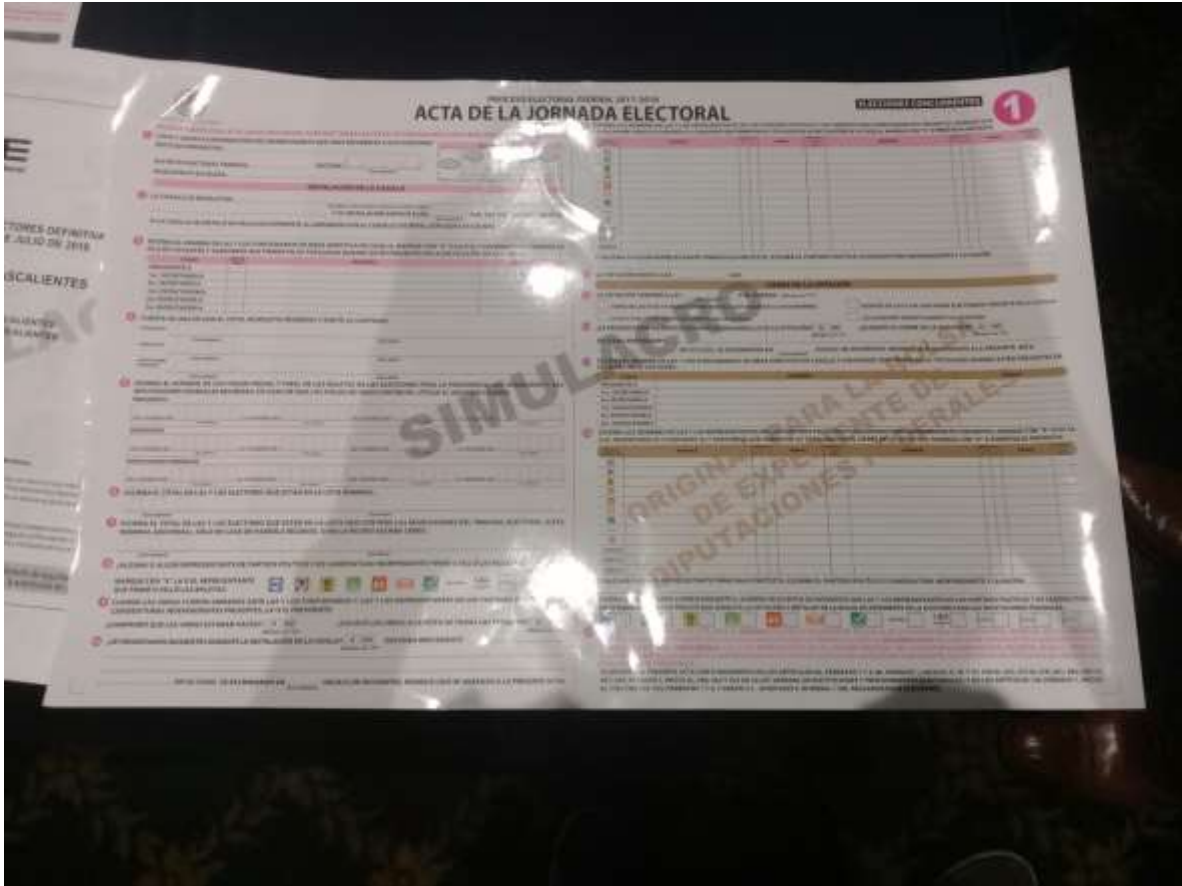
Modelo de Acta de Jornada Electoral utilizada en las Elecciones del 1 de julio de 2018.