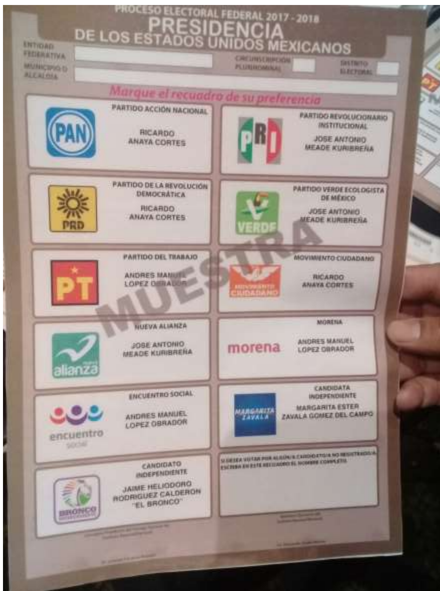
Modelo de la papeleta de Votación utilizada en las elecciones del 1 de julio de 2018.