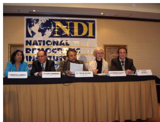
Miembros de la misión de observación mientras presentan los resultados en rueda de prensa celebrada el 3 de Junio en México DF