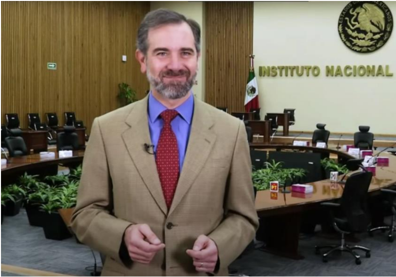
Dr. Lorenzo Córdova Vianello Consejero Presidente