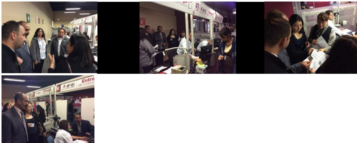
Visita de los funcionarios de la Comisión Central de Elecciones de Palestina al Módulo de Atención Ciudadana 091621.