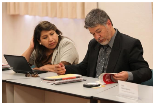
Bolivia Dina Chuquimia Vocal Tribunal Supremo Electoral Estado Plurinacional De Bolivia

En 1998 aparecen los sistemas de cuotas electorales, entre ellas la cuota electoral de género. Posteriormente, entre los años 2006 y 2010, se implementa una cuota electoral de pueblos indígenas. En la Ley de elecciones regionales y municipales ya está establecido 15% es para la cuota de género.