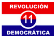
Partido Revolucionario Democrático