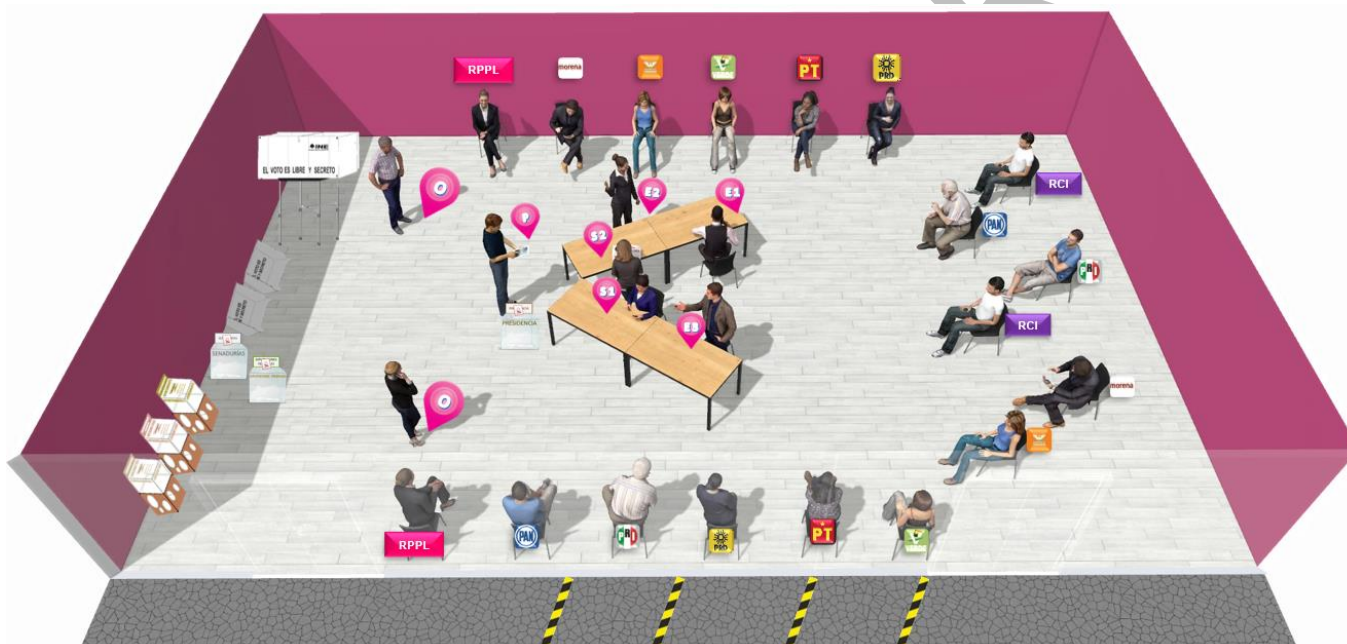
Imagen 3-C Disposición de mobiliario para el escrutinio y cómputo (mesas en “V” y RPPyCI colocadas tipo escuela y alternados)

En el caso de que se opte en el escrutinio y cómputo simultáneo por el acomodo anterior, la Presidencia de MDC deberá instruir que la colocación de las representaciones se disponga de tal forma que no se obstaculice la visibilidad de quienes se encuentran en la segunda fila, intercalándose las posiciones, tal como se muestra en la imagen.