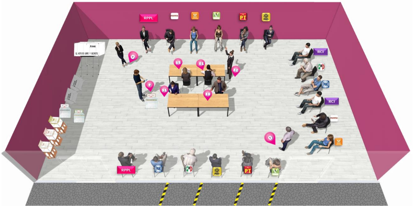
Imagen 3-B Disposición de mobiliario para el escrutinio y cómputo (mesas en “V”, y RPPyCI colocadas alrededor)