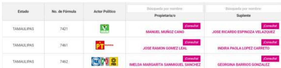
Resultados para Senaduria mayoría relativa:

El referido sistema permitirá a las personas candidatas cumplir con la obligación de difundir su información curricular y de identidad, establecida en el artículo 267, párrafo 3 del RE.