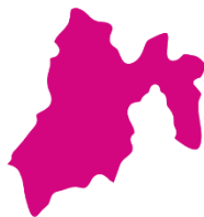
OPL Estado de México