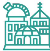
Centro de Investigación y de Estudios Avanzados del Instituto Politécnico Nacional, Unidad Tamaulipas.