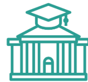
Universidad Autónoma Metropolitana, Unidad Iztapalapa.