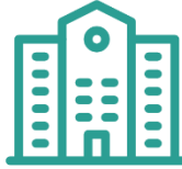
Instituto Tecnológico y de Estudios Superiores de Monterrey.