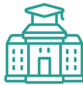
Centro Tecnológico de la Facultad de Estudios Superiores Aragón de la UNAM.