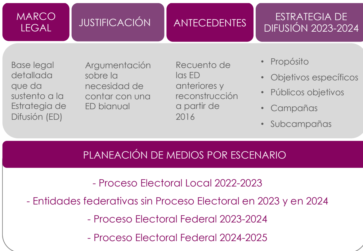
Ilustración 1. Estructura del documento

Asimismo, no se deja de lado que en 2023 y 2024 se considera la realización de dos ejercicios de democracia participativa: la Revocación de Mandato y la Consulta Popular; sin embargo, en la presente Estrategia no se incluyen puesto que la difusión de cada uno de estos ejercicios se establece en una metodología independiente, de conformidad con su respectiva regulación.