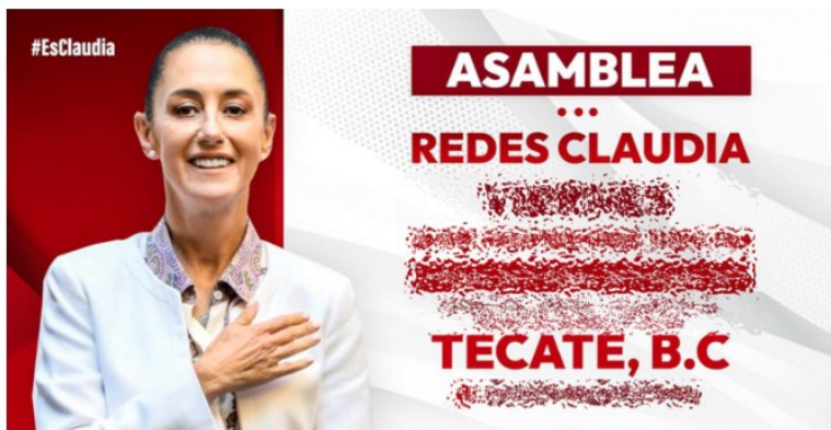
Imagen en publicación.

por la funcionaria con la impunidad y respaldo de los gobernantes que inclusive la invitan a sus eventos públicos.”